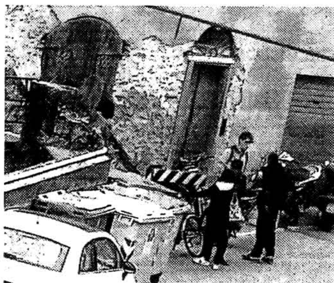
Alcuni ragazzi sorpresi a scambiarsi sostanze

Abitanti esasperati: «In pubblico e senza ritegno si iniettano eroina, abbandonando le siringhe e compiono atti vandalici»